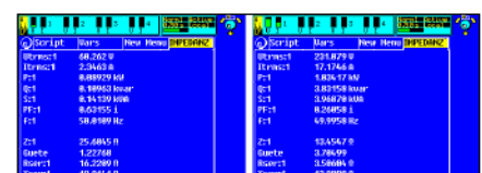
Bild 2: Anwenderdefiniertes Impedanz-Menü des Leistungsmessgerätes LMG500 a) Aussteuerung mit ca. 60V große Impedanz, kleine Güte b) Aussteuerung mit 230V: kleine Impedanz, große Güte